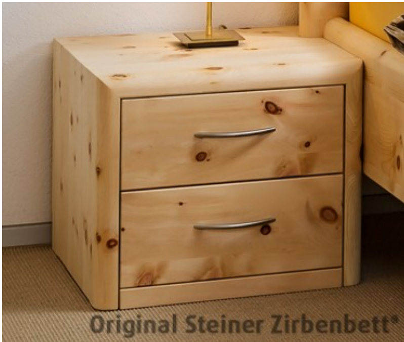
Original Steiner Zirbenbett®